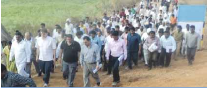
సందర్శకుల క్షేత్ర పరిశీలన

సందర్శకులందరూ కమ్యూనిటీ భాగస్వామ్యాన్ని మరియు వారు సంభాషించే పద్ధతులను చూచి కొనియాడారు. సందర్శకులు గమనించిన అంశం ఏమంటే రోజూవారి కార్యక్రమాలలో ప్రభుత్వ ప్రణాళికలలో మరియు పథకాలలో స్వయంచంద సంస్థల సహకారంతో కమ్యూనిటీ యాజమాన్య చొరపు ప్రదానంగా ఉండాలని భావించారు.