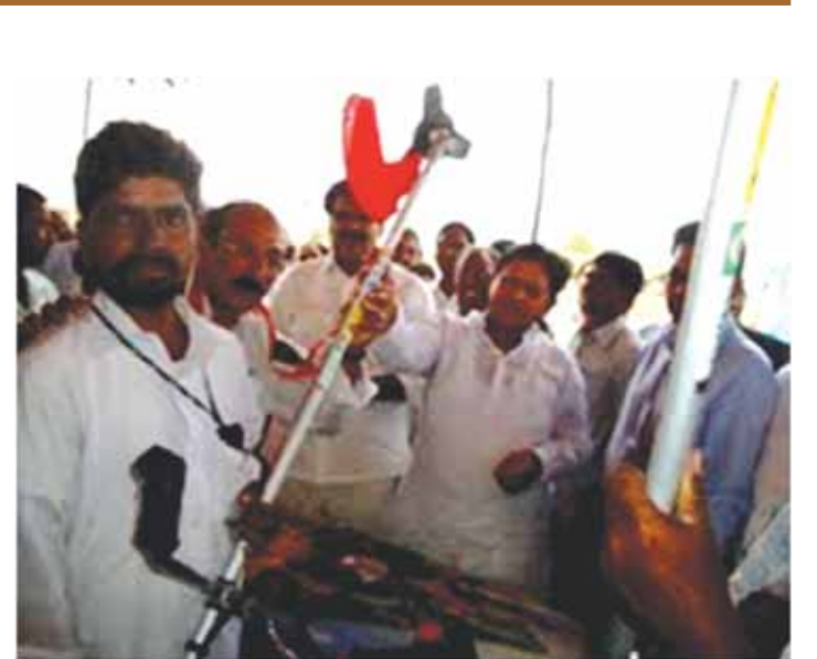
సిరికొండ, నిజామాబాద్ జిల్లాల్లో ట్రైబల్ కమిటీలకు బ్రెష్ కట్టర్లను 21 ఏప్రిల్ 2012 న అందిస్తున్న శ్రీ పి. సుధర్శన్ రెడ్డి, గౌరవనీయ భారీ నీటిపారుదల శాఖామత్స్యలు

ఆదిలాబాద్ డివిజన్, వ్యవసాయ మరియు ఉద్యానవన శాఖల సహకారంతో అదనంగా రూ.2.6 లక్షలను సమీకరించి 6 రోటరీ టిల్లర్లను కొనుగోలు చేయటం జరిగింది. కమిటీలు అన్ని వారి పొరువులను ఈ వ్యవసాయ పరికరాల పర్యవేక్షణ & నిర్వహణకు ఉపయోగించు కోవటానికి ఉత్సాహంగా వున్నారు.