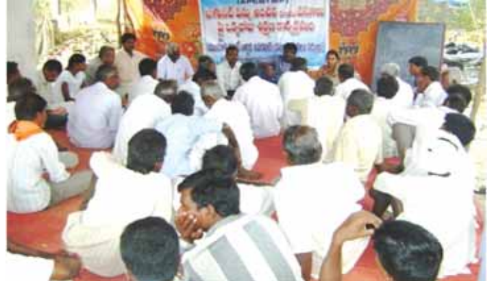
నీటిపన్ను అంచనా మరియు వసూళ్ళపై శిక్షణా కార్యక్రమం

హాజరుకావడం జరిగింది. ఇంతకుముందు జరిగిన నోడల్ సహాయసంస్థల సమీక్ష సమావేశంలో గుర్తించినది ఏమిటంటే ఈ శిక్షణా కార్యక్రమాలద్వారా అవగాహన పెరిగి నీటిపన్ను వసూళ్ళ కార్యక్రమం వేగవంతం కావటం జరిగింది.