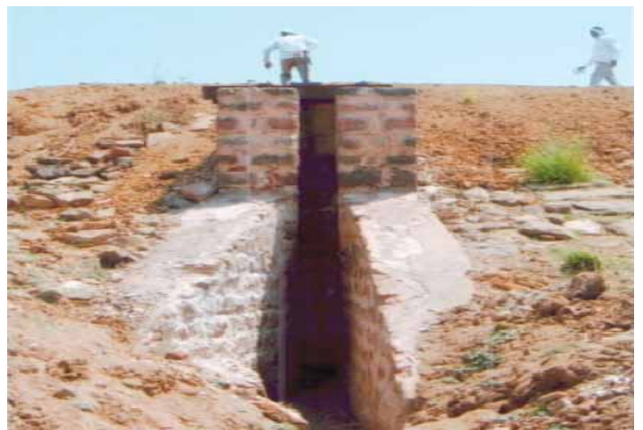
చెరువుకట్ట మరియు తూము పునఃనిర్మాణం తర్వాత

తూము సి.హెచ్ 31.45 వద్ద : సిల్స్థాయి +23.62 పూర్తిగా పాడయినది. పడిపోవడానికి సిద్ధంగా ఉంది. తూమువద్ద గుండి ఏర్పడడం కూడా జరిగింది. లీకేజీ కారణంగా నీరు ప్రక్కన ఉన్న లోయలోకి పోతున్నది. కాంక్రీటుతో తూము పైభాగం మరియు పెయిల్ గోడ పునఃనిర్మించడం జరిగింది. బుంగ భాగం కూడా బాగుచేయబడింది. గైడ్వాల్ మరియు అన్నడక్టు మసనరూ వద్ద లీకు లేకుండా కట్టడం జరిగింది. కాని నీరు చివరి ఆయకట్టుకు అందడం లేదు. గైడ్వాల్, తూమును బాగుచేయడం, మంఠిని నుండి గారెపల్లి రోడ్డు వరకు ఫీడర్ చానల్ కట్టడం ద్వారా నీరు చివరి ఆయకట్టుకు అందుతుంది.