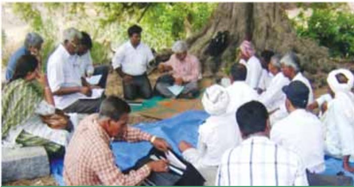
నీటి ఉత్పాదకత మరియు నీటి వినియోగ సామర్థ్యంపై అంచనావేస్తున్న ప్రాజెక్టు సిబ్బంది మరియు రైతులు