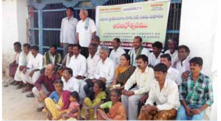
వస్తూ రూపంలో కార్పస్ వసూల ప్రారంభోత్సవ కార్యక్రమం