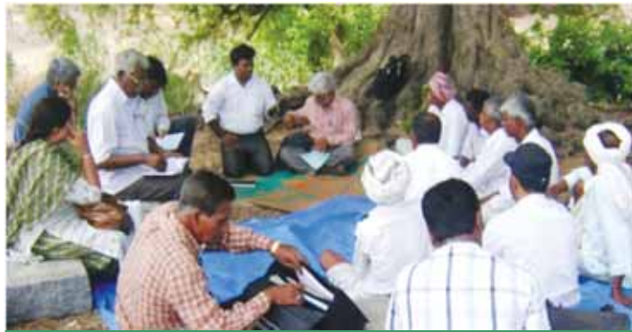
నీటి ఉత్పాదకత మరియు నీటి వినియోగ సామర్థ్యంపై అంచనావేస్తున్న ప్రాజెక్టు సిబ్బంది మరియు రైతులు