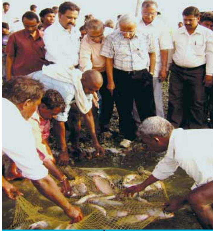
వల ద్వారా చేపలను పట్టడం

పెద్దచెరువు, పింజరుమడుగు గ్రామం, కామేపల్లి మండలం, ఖమ్మం జిల్లాను ఆంధ్రప్రదేశ్ సమాజ ఆధారిత చెరువుల యాజమాన్య పథకం క్రింద 2008వ సంవత్సరంలో గుర్తించటం జరిగింది. ఈ చెరువు 134 ఎకరాలలో 119 మంది ఆయకట్టుదారులతో మరియు 36 మత్స్యకారుల కుటుంబాలు అను రెండురకాల లబ్ధిదారులు చెరువుపై ఆధారపడి వున్నారు. ఈ చెరువు చేపల పెంపకానికి 50 ఎకరాల సామర్థ్య నీటి విస్తీర్ణం(20 హెక్టార్లు) కలిగి వున్నది.