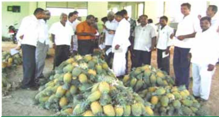
మధ్యనూరు మార్కెట్ విధానం వివరిస్తున్న అసిస్టెంట్ మేనేజరు