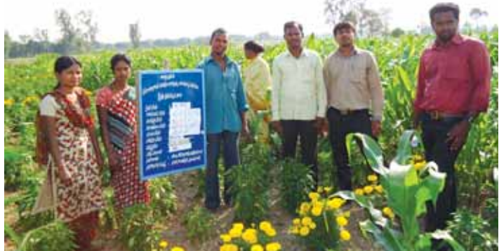
రెడ్లప్ప పొలంలో బోర్డరు పంట మొక్కజొన్న మరియు బంతిపూలు మిరపసాగు ప్రదర్శన క్షేత్రం

“నా లాభం నాలుగురెట్లు ఎక్కువ” అని రెడ్లప్ప గర్వంగా చెబుతున్నాడు.