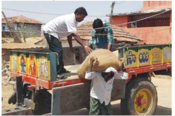
రైతుల సుంచి వరి సంచులను సేకరిస్తున్న నీటి వినియోగదారుల సంఘం

సా.నీ.సం. కార్పస్ అభివృద్ధి పై సమావేశం ఏర్పాటు చేసుకున్న రైతులు 2008 సం॥లో ఆంధ్రప్రదేశ్ సమాజ ఆధారిత చెరువుల యాజమాన్య పథకం క్రింద ఊరిచెరువు ఎంపిక కాబడింది. చాంద్రాయనపల్లి నీటి వినియోగదారుల సంఘం ప్రతిస్థాయిలో పనులను పర్యవేక్షించడానికి 6గురు సభ్యులు, 4 సబ్ కమిటీలు ఉన్నాయి.