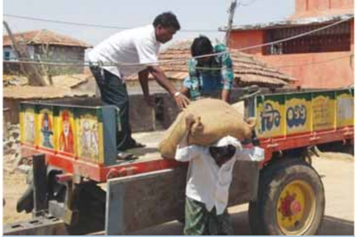
రైతుల సుంచి వరి సంచులను సేకరిస్తున్న నీటి వినియోగదారుల సంఘం

“సాగునీటి సంఘాల సుస్థిరత కోసం మొదటిసారిగా 30 మంది రైతులు 36 వరి ధాన్యం సంచులు (ఒక్కొక్క సంచి 70 కి.గ్రా., రూ.700/-) ఇవ్వడంతో 30 మంది రైతులు రూ.25,500 సహాయం చేయడం జరిగింది.”