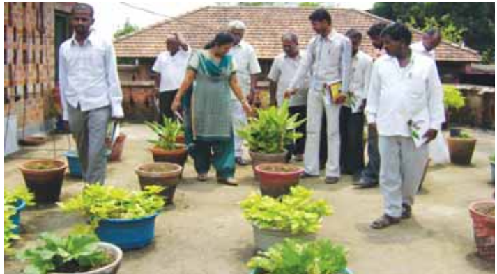
కాకినాడు, కొచ్చిన్ లో టెర్రస్ ఉద్యానవన ఏర్పాటు చేసిన వి.యస్.పి.సి.