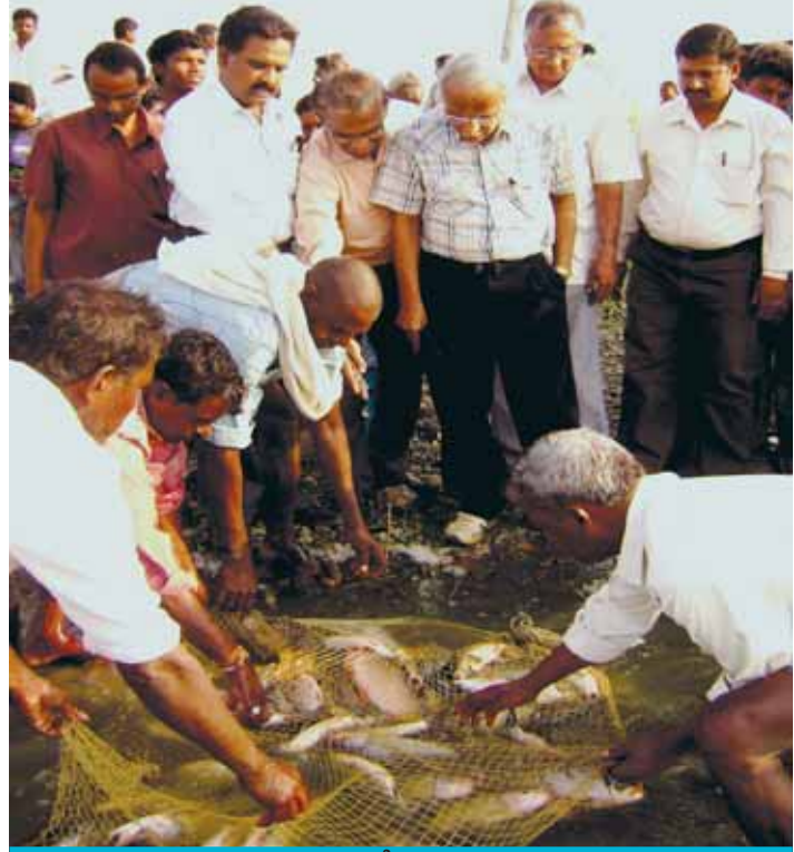
వల ద్వారా చేపలను పట్టడం

పెద్దచెరువు, పింజరుమడుగు గ్రామం, కామేపల్లి మండలం, ఖమ్మం జిల్లాను ఆంధ్రప్రదేశ్ సమాజ ఆధారిత చెరువుల యాజమాన్య పథకం క్రింద 2008వ సంవత్సరంలో గుర్తించటం జరిగింది. ఈ చెరువు 134 ఎకరాలలో 119 మంది ఆయకట్టుదారులతో మరియు 36 మత్స్యకారుల కుటుంబాలు అను రెండురకాల లబ్ధిదారులు చెరువుపై ఆధారపడి వున్నారు. ఈ చెరువు చేపల పెంపకానికి 50 ఎకరాల సామర్థ్య నీటి విస్తీర్ణం(20 హెక్టార్లు) కలిగి వున్నది.