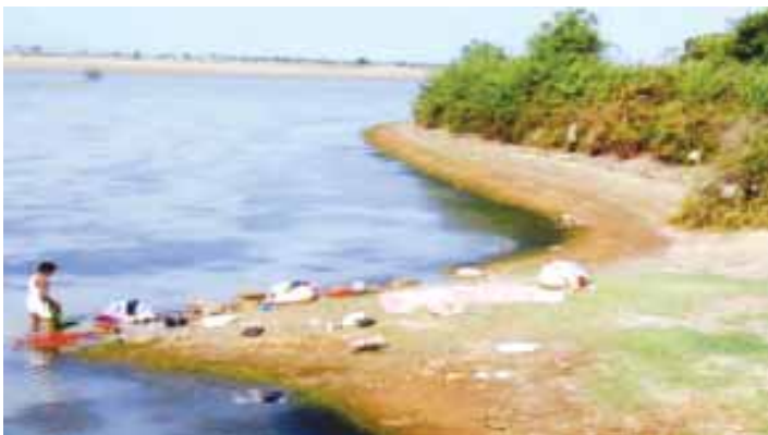
చెరువుకట్ట పునఃనిర్మాణానికి ముందు

కరీంనగర్ జిల్లా, మంచినీ మండలంలోని శాస్త్రులపల్లి గ్రామంలో పెద్దచెరువు క్రింద 335 ఎకరాలు ఆయకట్టు ఉన్నది. 2007 సం॥ ముందువరకు ఎలాంటి మరమ్మత్తులుగాని, లేదా పనులుగాని చేపట్ట లేదు. ఈ చెరువు ఎపిసిబిటియం ప్రాజెక్టు క్రింద ఎన్నిక కాకముందు చెరువుకు పెద్ద మరమ్మత్తులయిన చెరువు కట్ట, రెండు తూములు మరియు ఫీడర్చానల్ బాగుచేయవలసి ఉంది. టింప్ లో 34 లక్షల రూపాయల చెరువు పునరుద్ధరణ కార్యక్రమాలు చేపట్టవలసిన అవసరం ఉందని చెప్పడం జరిగింది. గాప్ ఆయకట్టు 88 ఎకరాల నుండి 5 ఎకరాలకు తగ్గినది.